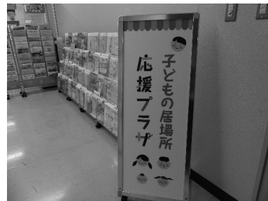
子どもの居場所応援プラザ